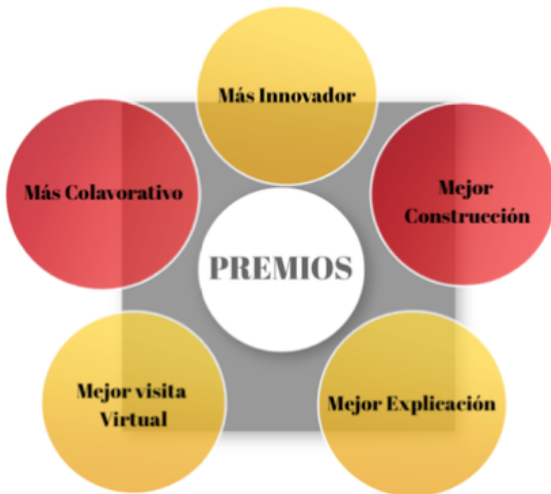
Figura 4 Premios para cada uno de los grupos

Al terminar las visitas virtuales, el profesor será el encargado de entregar varios premios. Estos serán: a la mejor construcción, la mejor visita virtual, al grupo más innovador, a la mejor explicación y al grupo más colaborativo. Se establecen por lo tanto 5 premios, de modo que, si el docente valora positivamente el trabajo de toda la clase, pueda entregar uno a cada uno de ellos (ver Figura 4).