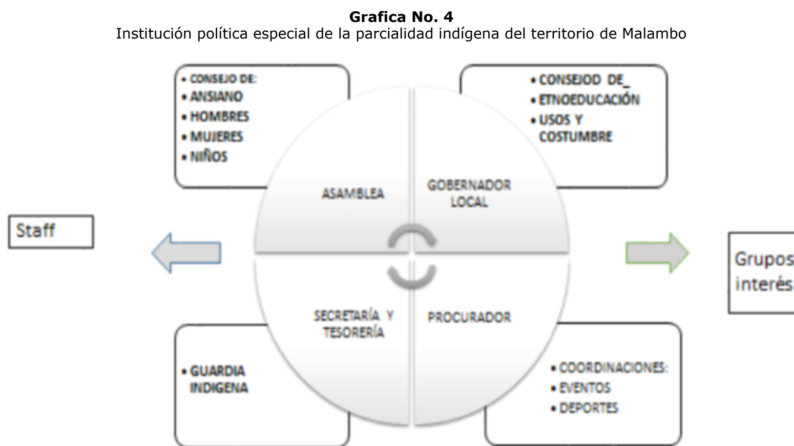
Diseño propio tomado de entrevistas maestro Mokana (2017)

Inicialmente en julio del 2006 la etnia obtuvo el reconocimiento nacional como un cabildo urbano, indígena, y posteriormente en 2014 asumió la calidad de Parcialidad Indígena especial con autonomía. Lo cual le ha permitido a la etnia como institución ser independiente en sus decisiones y planes de desarrollo. De acuerdo a información del DANE (2005) existen como miembros del cabildo en Malambo, 1723 hombres y 1641 mujeres. A continuación en la gráfica 4 se presenta la organización del Cabildo urbano según Blanco, (2017).