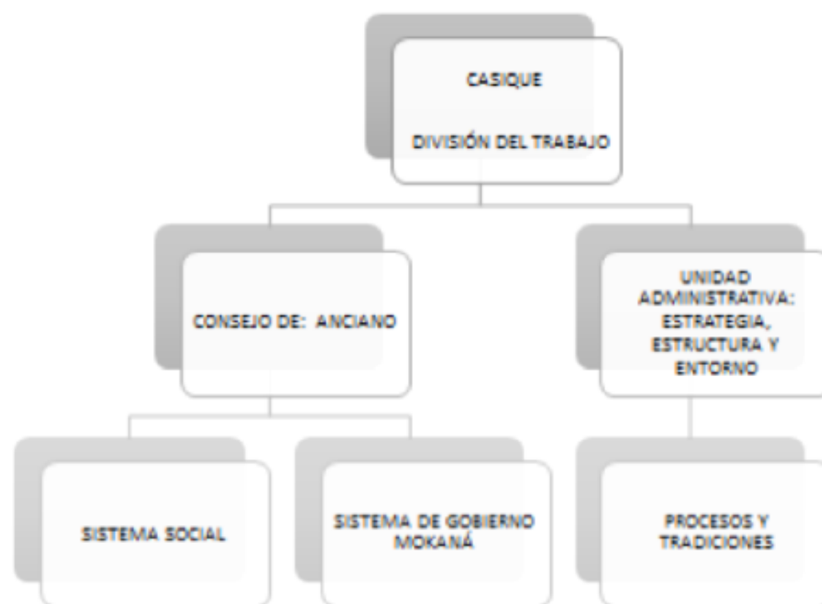
Gráfica No. 1 Organización de la cultura Mokaná, en la Edad de Piedra

Diseño propio tomado de entrevistas con maestros Mokana (2017)