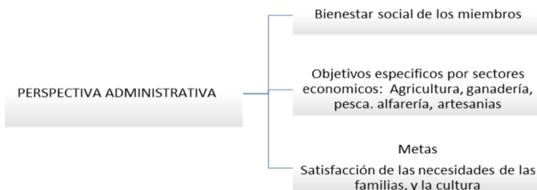
Gráfica No. 2 Perspectiva administrativa, de la etnia Mokaná del territorio de Malambo, edad de piedra

Diseño propio tomado de entrevistas maestros Mokana (2017)